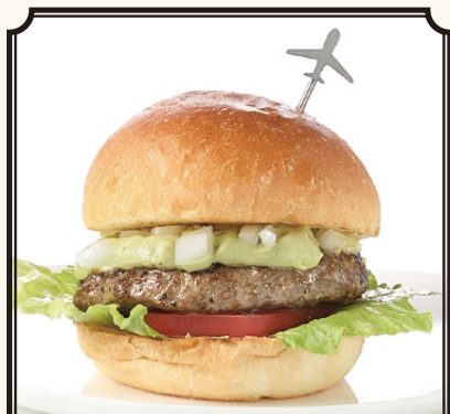
DOUG'S CALIFORNIA GUACAMOLE BURGER