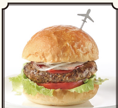
DOUG'S CALIFORNIA BURGER