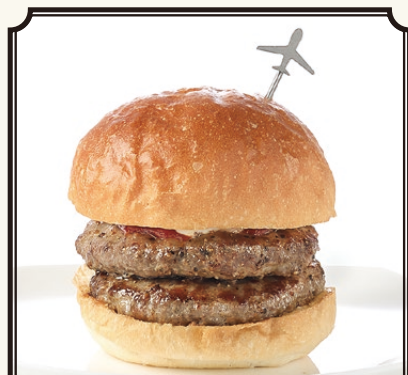
DOUG'S CALIFORNIA DO.W.A.T. BURGER

《LAVA》 Make the cheese overflow! Make it LAVA! The ultimate burger for cheese lovers! LAVA (溶岩) のように溢れるチーズ! チーズ好きにはたまらないハンバーガーです!