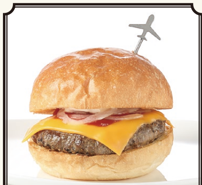
DOUG'S CALIFORNIA NO VEGGIES CHEESE BURGER